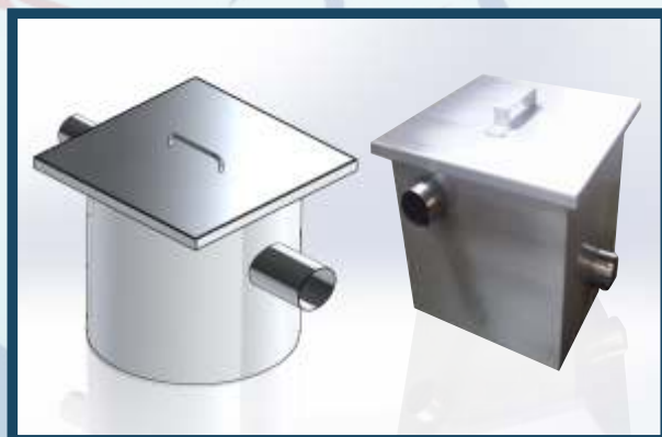
CAIXA DE GORDURA - Redonda ou quadrada.