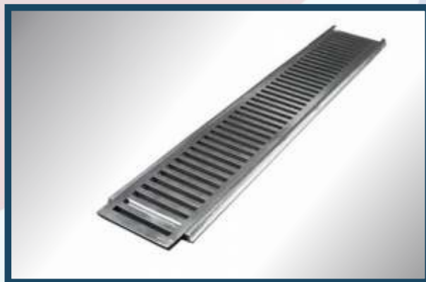
RALO LINEAR - Totalmente sob medida.