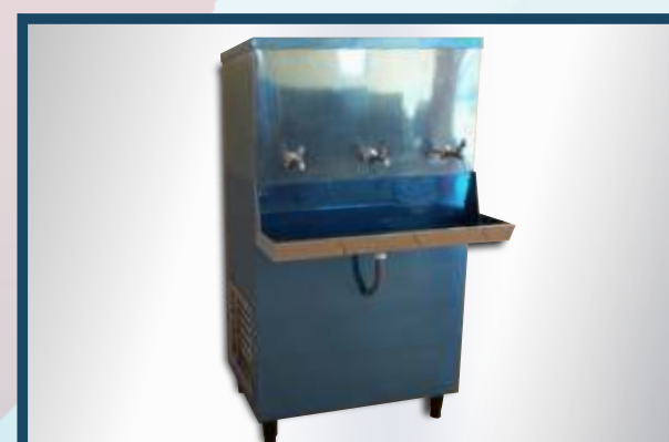
BEBEDOURO INDUSTRIAL - Opção quente e frio.