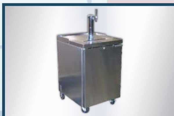
CHOPEIRA - Para o seu negócio ou casa.