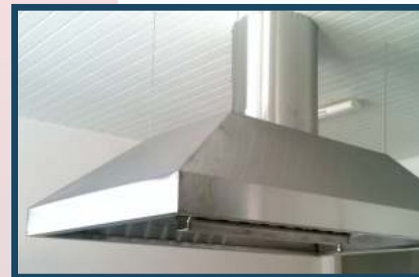
COIFAS - Tamanho e angulação sob medida.