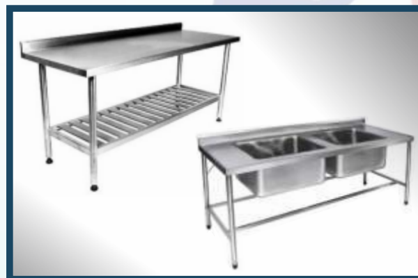
MESA INOX - Tampo liso ou cubas assépticas.