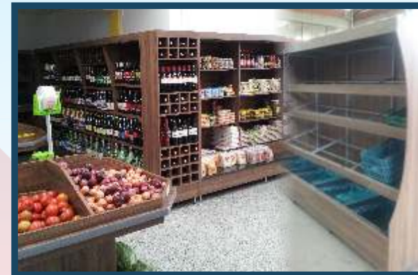
FRUTEIRAS E GÔNDOLAS - Tamanhos e espaços personalizados para o seu negócio.

Oferecemos uma variedade de produtos que proporcionam soluções para o seu negócio. Todos os produtos da COYOTE REFRIGERAÇÃO são feitos de maneira personalizada, atendendo às necessidades de cada cliente.